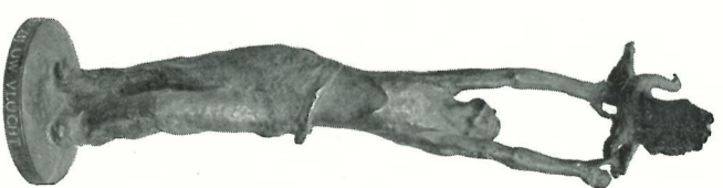
Monument, aangeboden door ons personeel en staande op het voorterrein van onze fabriek te den Haag. Het deus inhoudt: „HOGER ZIJ UW VLUCHT”.